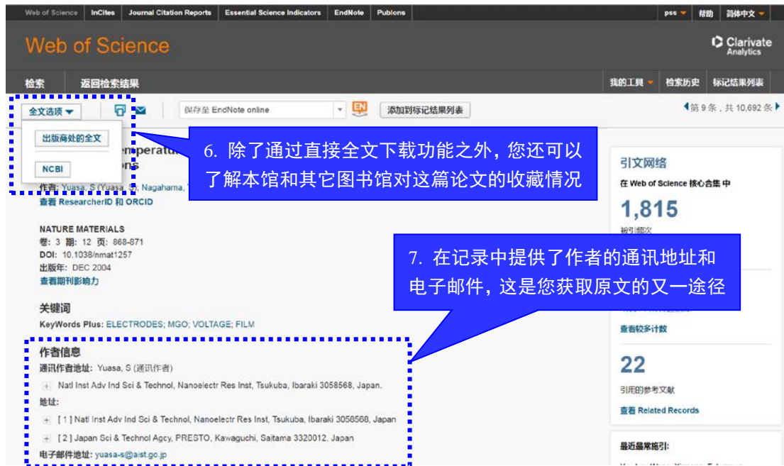
图 3 全记录界面中获取全文的方式