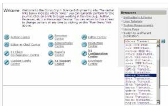
同一门户内可自由切换不同的期刊