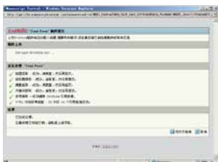
自动提取稿件信息及生成参考文献链接