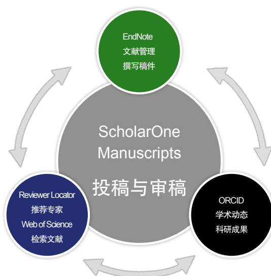
ScholarOne Manuscripts与Web of Science EndNote和ORCID无缝集成