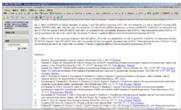
HTML格式稿件可自动生成参考文献链接